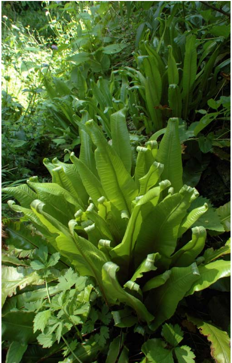
Tongvaren (Asplenium scolopendrium)

De Tuin van Sjef kunt u bezoeken (in de periode 1 april – 31 oktober) na een telefonische afspraak met Sjef van der Molen, Boulevard 33a, 6881 HP Velp, tel.: 026 363 61 13. Ook kunt u het werk in de Tuin van Sjef steunen door een gift over te maken op Postbankrekening 9484665 ten name van Stichting de Tuin van Sjef, te Velp.