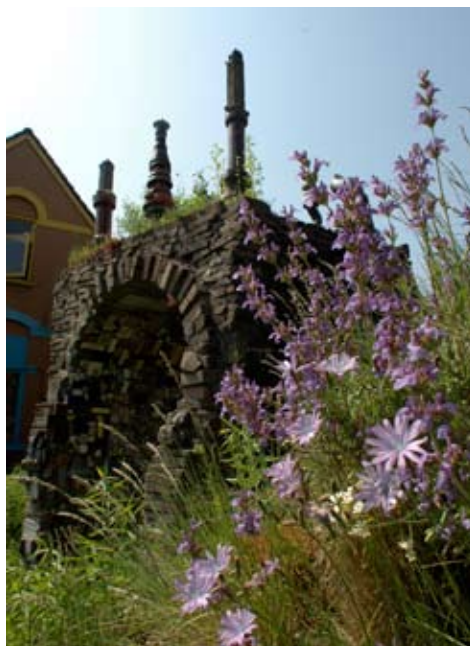
Blauwe sla ( Lactuca perennis ), lavendelbladige salie ( Salvia lavandulaefolia ) en wimperparelgras ( Melica ciliata ) op een kalkheuvel: met het poortje op de achtergrond.