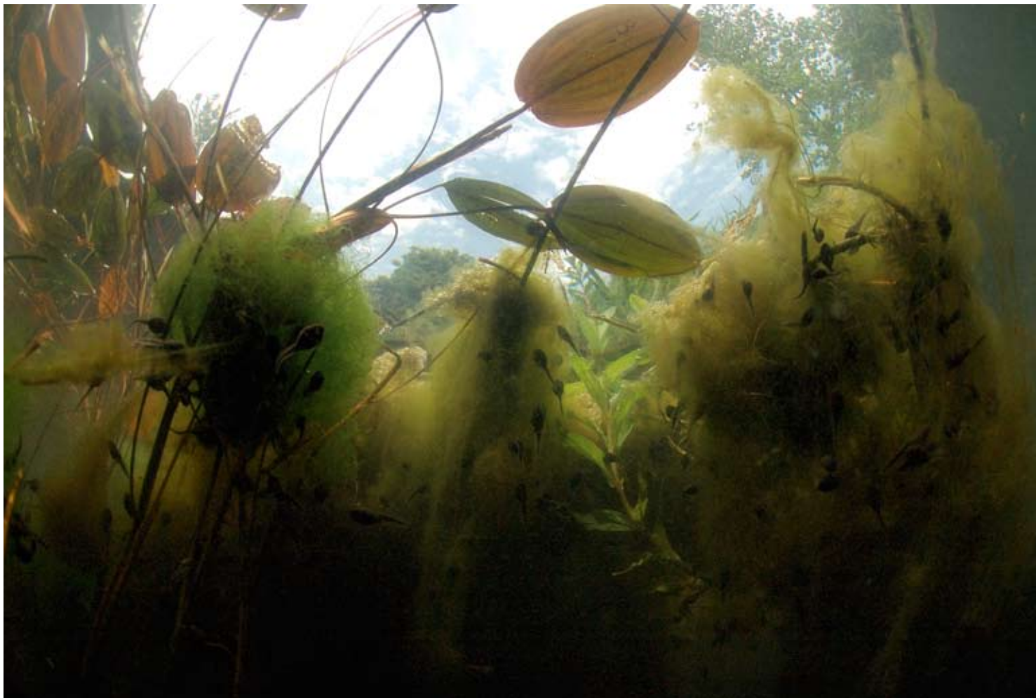
Dikkopjes van de gewone pad ( Bufo bufo ) grazen in kolonnes de algen van de waterplanten af.