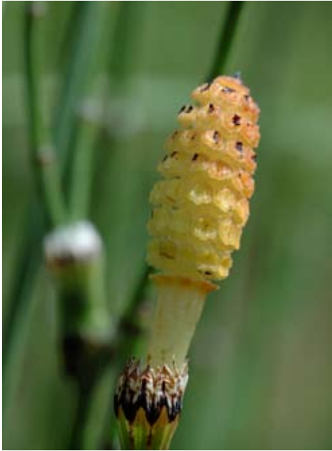
'Bloeiwijze', sporangiofoor van de bonte paardenstaart ( Equisetum variegatum ). Een zeer zeldzame en bedreigde soort in Nederland.