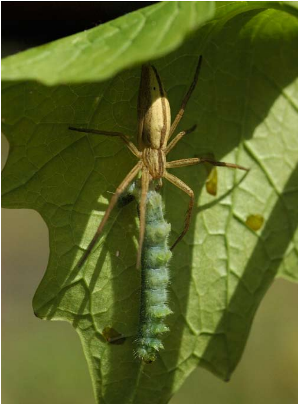
De gewone sprietspin ( Tibellus oblongus ) heeft een forse prooi te pakken, een rups van de bruine snuitvlinder ( Hypena proboscidalis ).

En dan nu een en ander over onze tuin in 2007. In de vorige nieuwsbrief maakte ik gewag van de diverse ontwikkelingen en gebeurtenissen op deze locatie.