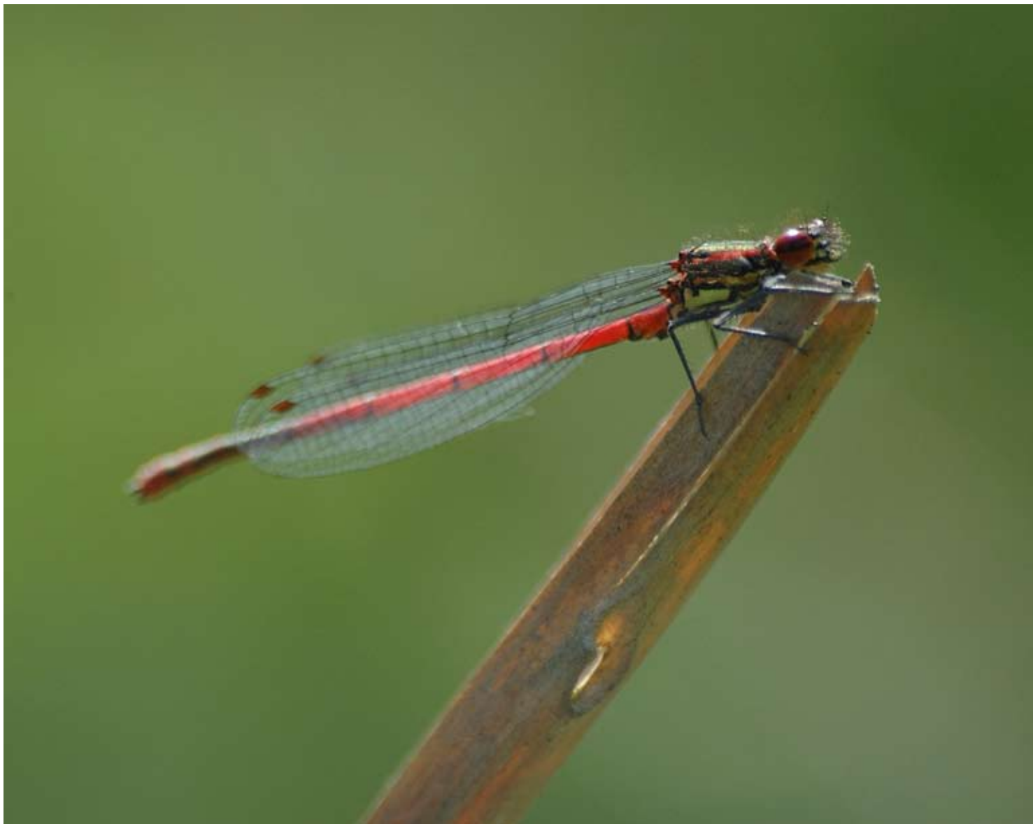
De vuurjuffer is een van de vroegste en algemeenste libel in onze tuin.

aurelia. Daggauwoog en kleine vos waren matig aanwezig, zo ook het citroentje. Verder werden er begin augustus een bruin zandoogje, icarusblauwtje en kleine vuurvlinder waargenomen. De “drie” koolwitjes waren rijk vertegenwoordigd, opvallend was het flinke aantal grote koolwitjes van de tweede generatie in juli tot begin oktober.