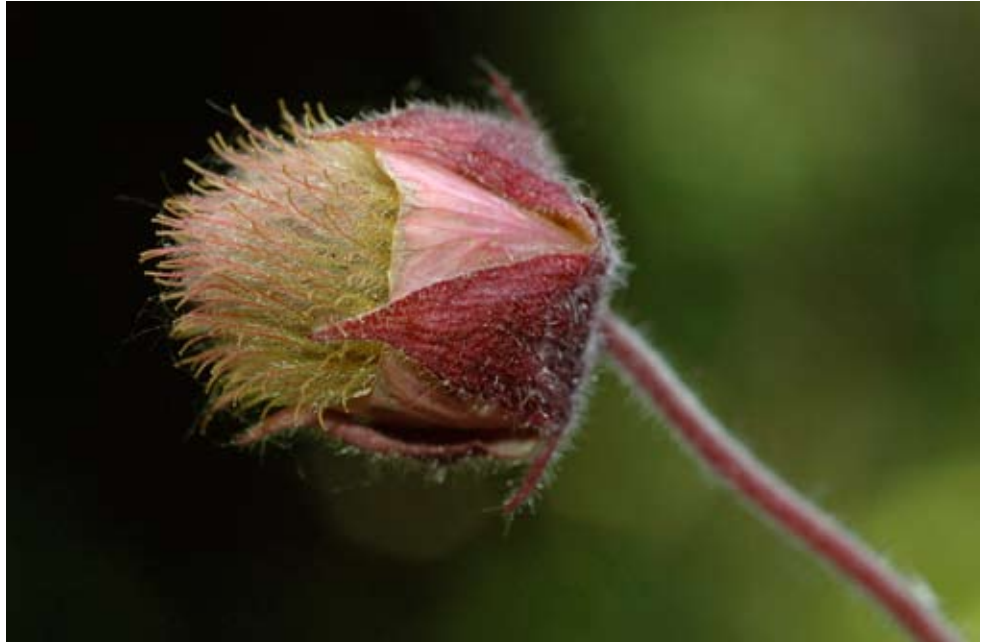
Knikkend nagelkruid ( Geum rivale ) wordt slechts op enkele plaatsen gevonden in ons land.